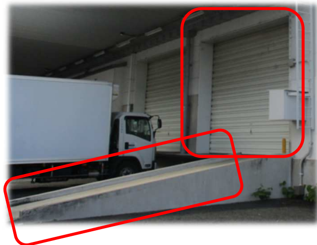
南側バース (フォーク用スロープあり)