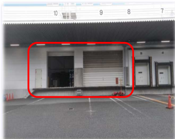
南側バース (フォーク用スロープあり)